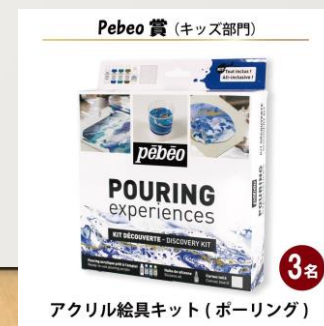
アクリル絵具キット (ポーリング)