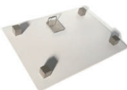
吊り金具をパネルに付けたイメージ